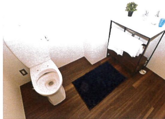
◆1Rタイプ 3F(反転タイプ)◆40.64㎡